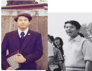
1978年 立川高校 入学式

私にとって立高受験そのものが「かなりの背伸び」であったことを否定できない。中学3年夏から(遅すぎだろ!)スパルタ進学塾にジョインして猛烈に勉強し(余りにスタートが遅すぎて後から考えるとマイルストーンどころではなかった)、勢い余って有名私立大学高等学院(!)まで合格してしまったが、周囲の反対を押し切って立高を選んだことを後悔していないのは、立高での3年間で今の私を形作っているからである。