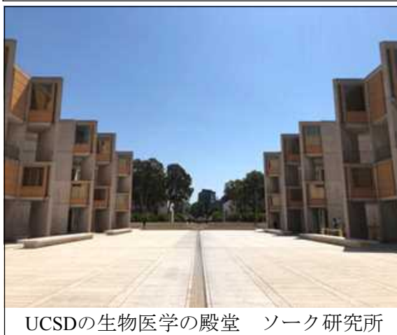
UCSDの生物医学の殿堂 ソーク研究所